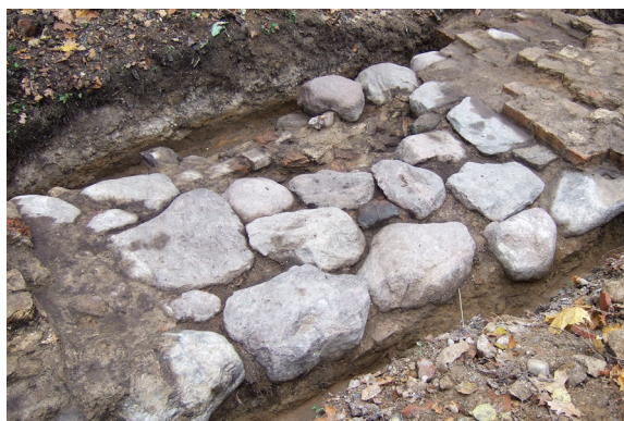
8 pav. R piliavietės kiemo pakraštyje atidengto pastato P sienos mūro fragmentai. Vaizdas iš P pusės.

Fig. 8. Fragments of the building's S wall unearthed on the E edge of the castle's bailey. View from the S.