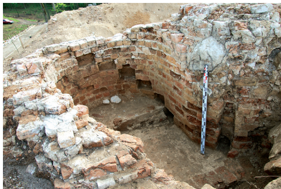
Fig. 3. A fragment of the stairwell wall as viewed from the E.

3 pav. Laiptinės mūro fragmentas iš R. A. Zalepūgienės nuotr.