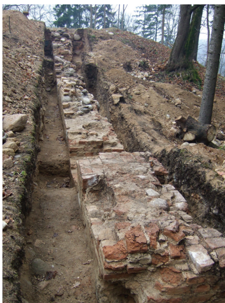
7 pav. Įvažiavimo vartai iš ŠR.

Fig. 8. Fragments of the building's S wall unearthed on the E edge of the castle's bailey. View from the S.