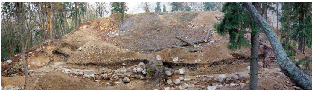
Fig. 6. Fragments of the curtain wall as viewed from the S.